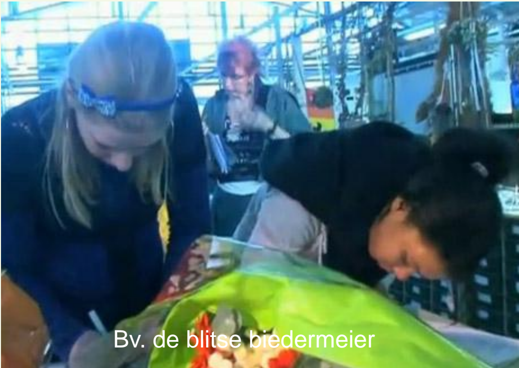
Bv. de blitse biedermeier