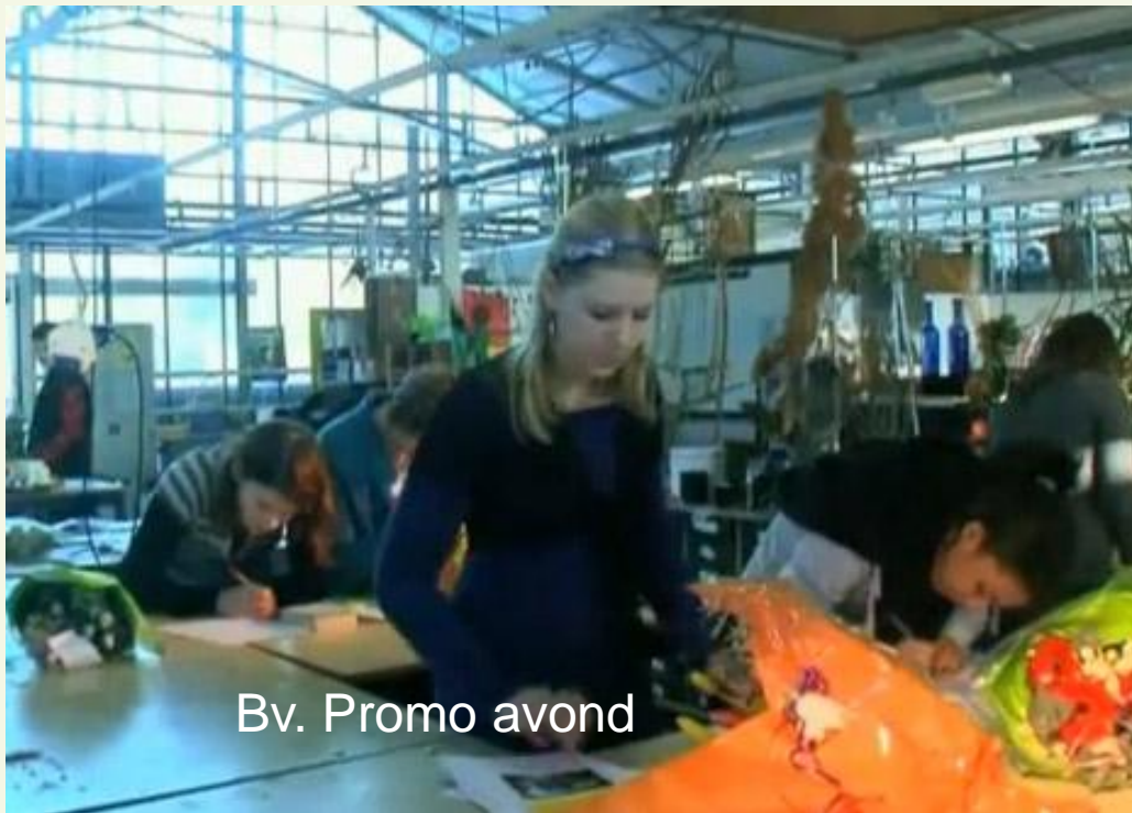
Bv. Promo avond