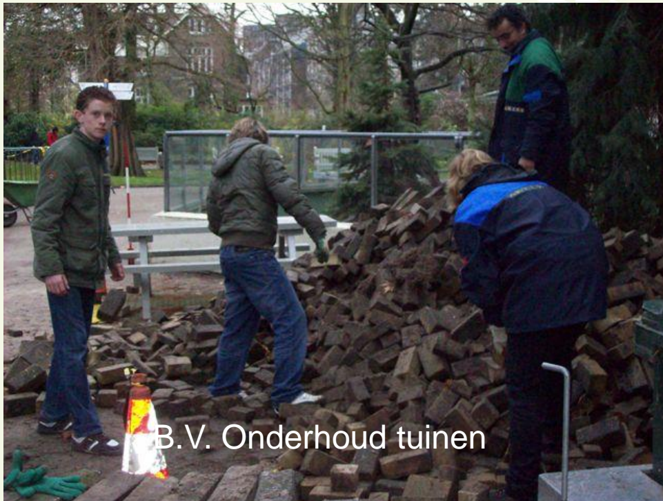
B.V. Onderhoud tuinen